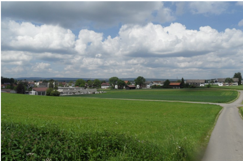
Foto: Bestand, Blick auf das geplante Baugebiet „Tal“ (Grünland im Vordergrund links bis zur Straße)

Im Gegenzug soll im FNP eine bestehende, geplante aber ungeeignete Mischbaufläche in landwirtschaftliche Fläche umgewidmet werden (Flächentausch, s. Seite 4-5).